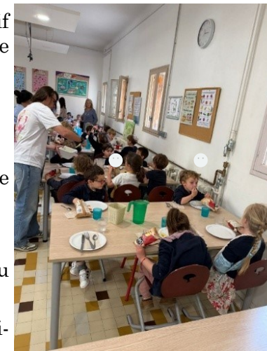
Le repas des petits dans leur réfectoire, servis par les « grands »

Entre chaque bouchée, les questions fusaient : « comment tu t'appelles... Quel âge tu as ? »