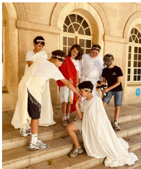
Les Romains d'un jour accueillent l'empereur Caracalla.