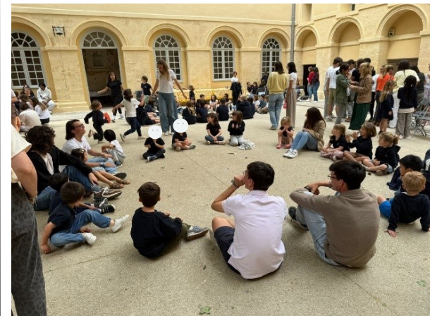
Après le repas, le temps des jeux

Il régnait dans la cantine un joyeux brouhaha, la joie était au rendez-vous aussi bien pour les petits que pour les grands.