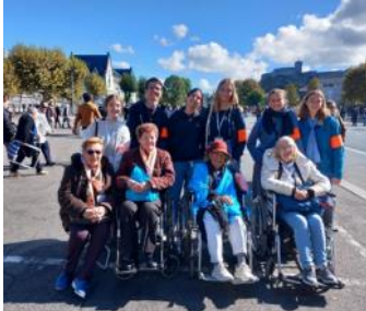
Les élèves avec les personnes âgées

Au début du mois d'octobre, dix-sept jeunes (de la Seconde à la Terminale) accompagnés de deux enseignants, sont partis assister au pèlerinage de Lourdes. Les jeunes ont accompagné des malades tout