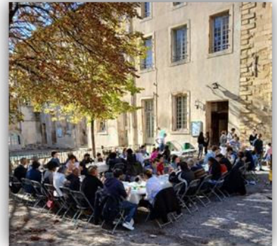
Repas et partage avec les personnes démunies

Ce furent des beaux moments de partage et de rencontre autant pour les élèves que pour les personnes invitées. Au total 70 personnes, parmi lesquelles une quinzaine d'élèves, se sont réunies pour échanger et partager.