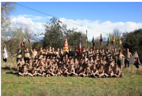
Troupe 1 Aix

**Patrouille : c'est une petite troupe de 7 à 8 personnes.