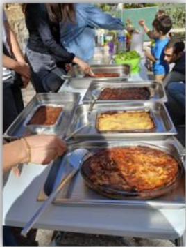
Les élèves, les familles et les enseignants ont servi le repas

D'autres projets de la pastorale sont dans la continuité des années précédentes, comme les repas solidaires. Le 27 octobre et le 1 er décembre, les élèves ainsi que des familles et des professeurs se sont retrouvés pour partager un repas avec les plus démunis.