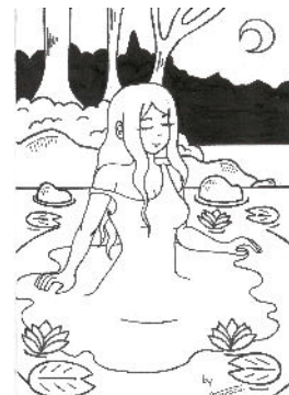
Dessin MéliA Amrane, 2e A