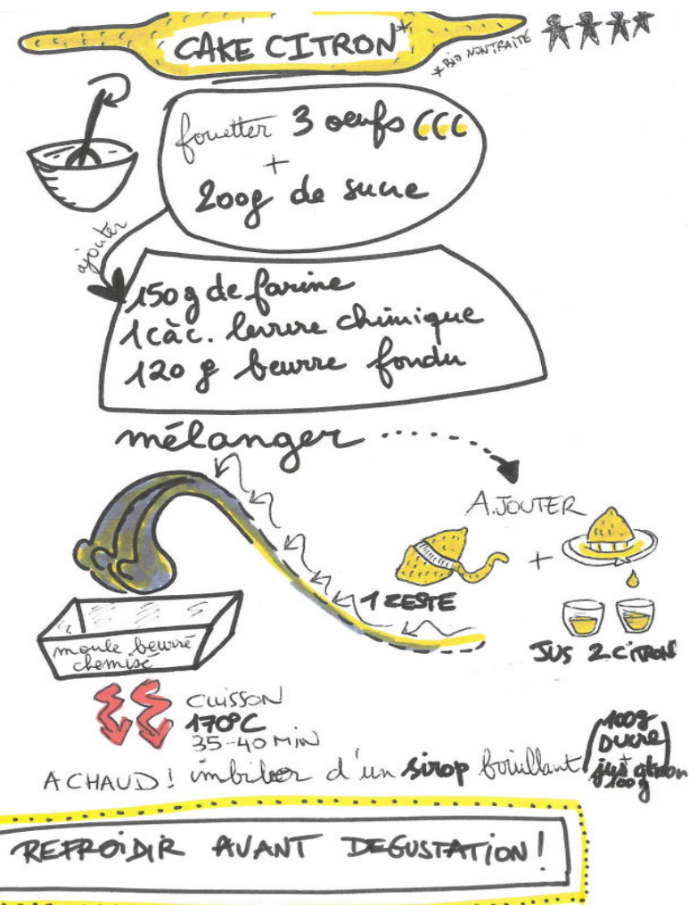
Aldée Lacombe-Picard, 6e A