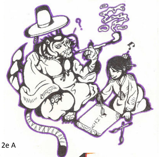
Mélia Amrane, 2e A