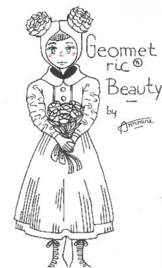
Geometric Beauty by Amrane